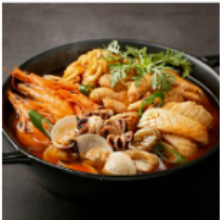
시원한 술안주 푸짐한 해물탕 21,040 원