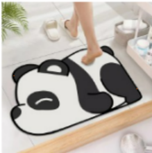
규조토발매트 주방 욕실 화장실 소 프트 물 흡수 빨아쓰는 구조토 매트 13,900 원