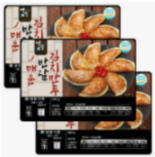
백송 매운 반달 김치만두 480g ( X3 봉) 43,420 원