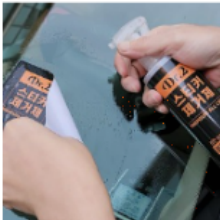
자동차 냄새없는 스티커제거제 200ml 12,380 원