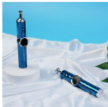
[닥터펜] 프로 EMS 충전식 저주파 셀프 마사지기 49,530 원