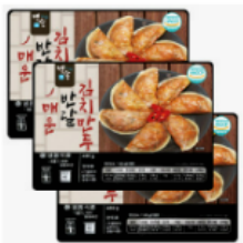
백송 매운 반달 김치만두 480g ( X3 봉) 43,420 원