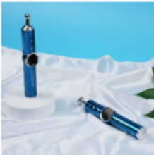
[닥터펜] 프로 EMS 충전식 저주파 셀프 마사지기 49,530 원