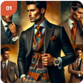
설포유 프라임 포틀러 250,000 원 / 000 개