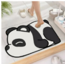
규조토발매트 주방 욕실 화장실 소 프트 물 흡수 빨아쓰는 규조토 매트 13,900 원