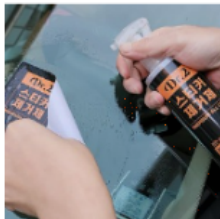
자동차 냄새없는 스티커제거제 200ml 12,380 원