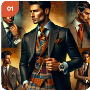
설편유 프라임 포물러 250,000 원 / 000 개